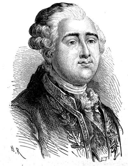
Людовик XVI. Гравюра Э. Тома с портрета работы А. Руссо

XVIII столетия самыми разными странами, переживающими в наши дни радикальные перемены, не хватит и книги.