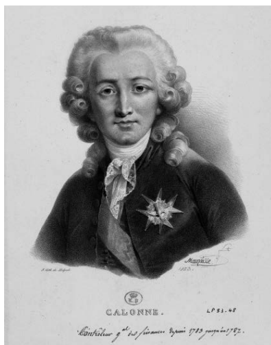
Шарль-Александр де Калонн. Эстамп с портрета кисти Э. Вижэ-Лебрён

мало-мальски конфликтными ситуациями, опасался резких действий после того, как в 1774–1776 годах финансовые реформы его министра Тюрго вызвали активное сопротивление аристократии с Парижским парламентом во главе. Однако зияющая дыра в бюджете вынуждала Калонна идти на решительные шаги, даже рискуя навлечь на себя ненависть привилегированных сословий.